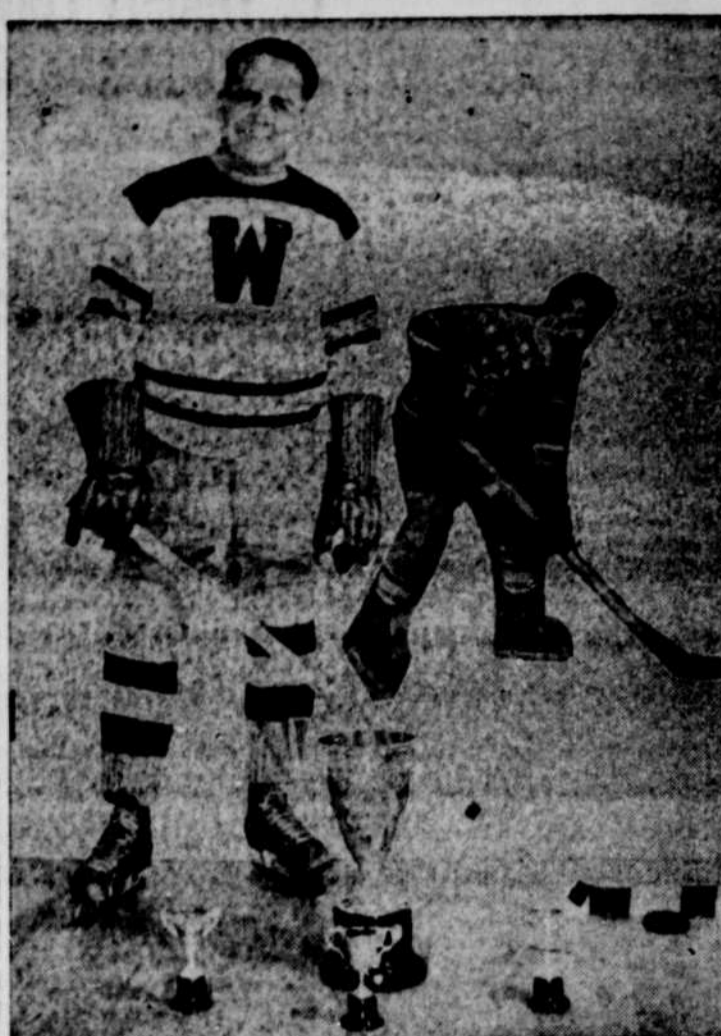
Samedi matin, vers 8 hres, Edmond Bouchard, que la pratique de notre sport national a rendu célèbre, s'est éteint à l'âge de 61 ans, à la suite d'une longue maladie. La photo ci-dessus rappelle le séjour de Bouchard sous la grande tente, alors qu'il évoluait pour les Américains de New-York.