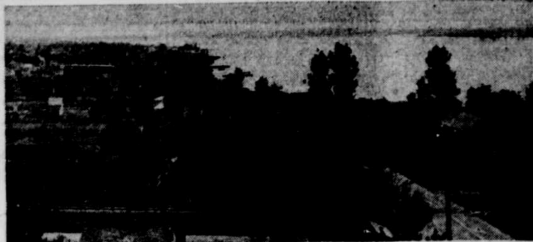
Le Lac-à-la-Tortue est probablement le coin préféré des villégiateurs qui passent des vacances dans la Mauricie. En fin de semaine et le soir, des centaines de baigneurs se rafraîchissent sur les rives sablonneuses et superbes de ce lac que l'entreprise privée réserve au public en général.