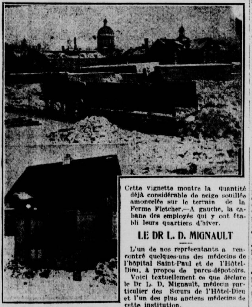
Cette vignette montre la quantité déjà considérable de neige soulevée amoncelée sur le terrain de la Ferme Fletcher. À gauche, la cabane des employés qui y ont établi leurs quartiers d'hiver.

Cette année, encore, en dépit des énergiques protestations de toute la presse de Montréal, et en dépit de l'intervention des autorités des parcs, l'on est revenu à l'ancien système, et, déjà, la neige provenant de nos rues, s'accumule sur nos deux parcs sous les fenêtres des deux hôpitaux mentionnés ci-dessus. Et cela est fait en vertu d'une résolution du conseil, en date du 23 décembre, recommandant l'adoption d'une résolution de la voirie. Ce sont ces deux résolutions dont la légalité sera attaquée devant les tribunaux aujourd'hui même, par l'entremise de la "Patrie."