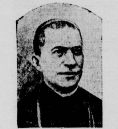
Le cardinal SATOLLI

ROME, 10. — L'Eglise vient de perdre un de ses fils les plus illustres, dans la personne de Son Eminence le cardinal Francesco Satolli, préfet de la Congrégation des Etudes, décédé samedi matin, à l'âge de 70 ans, à la suite d'une longue et douloureuse maladie.