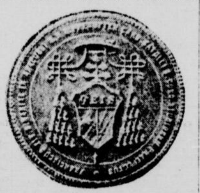
Les armes du cardinal SATOLLI.

Le préfet de la Congrégation des Etudes fut toujours un admirateur