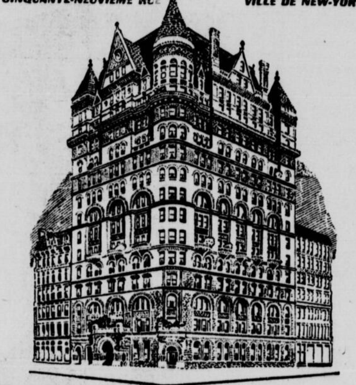
UN HOTEL EXCLUSIF POUR le CONFORT. ENTIEREMENT à L'EPREUVE du FEU

Une hôtellerie de premier ordre pour la clientèle difficile. Une résidence agréable pour les Canadiens qui visitent New-York.