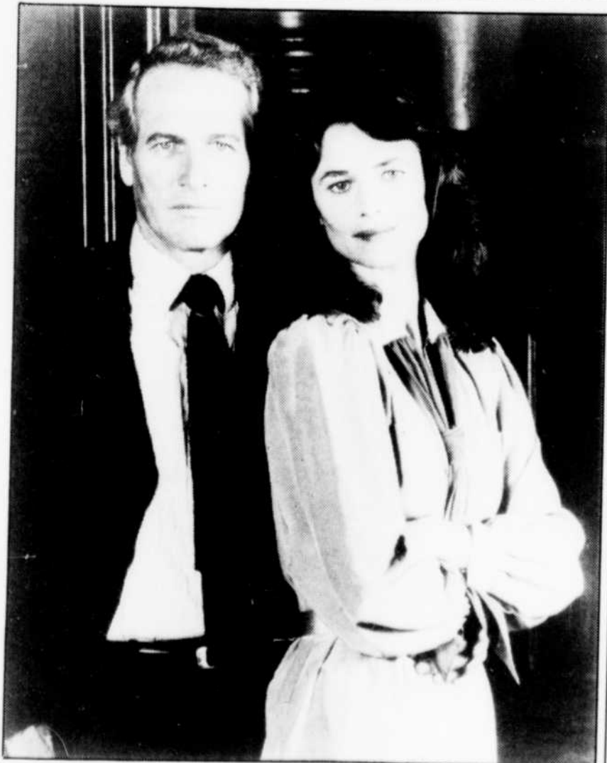
« Le verdict », drame judiciaire de S. Lumet, mettant en vedette Paul Newman et Charlotte Rampling, au CINEMA de 23h25, vendredi, à Radio-Canada.