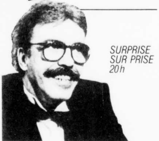
SURPRISE SUR PRISE 20h

CAMERA 89 : ÉDITION SPÉCIALE Les naufragés de la drogue 21h