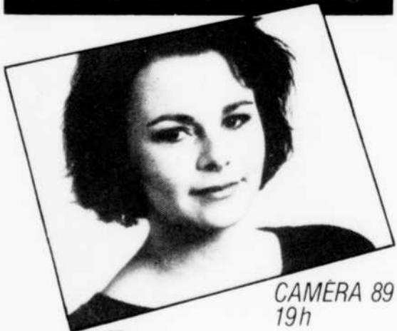
CAMERA 89 19h