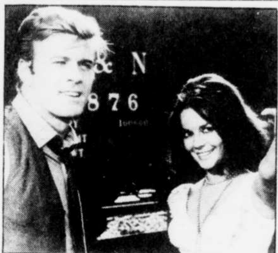
Robert Redford et Natalie Wood dans « Propriété interdite », à BLEU NUIT, jeudi, 23h30, à TQS.

trêmement difficile à pratiquer. En reprise vendredi, 16h30. 23h20 2 6 7 11 12 13 A PREMIÈRE VUE Reprise de 17h30. 9 13 CINÉMA POUR VOUS CRIS DANS LA NUIT. (2h10) 23h25 4 5 6 7 9 10 511 FRANC PARLER Avec Clinton Archibald. 23h30 2 BLEU NUIT PROPRIÉTÉ INTERDITE. (2h05) 3 THE PAT SAJAK SHOW (1h30) 5 BRIER NITE LIVE! Faits saillants de la journée. 5 THE TONIGHT SHOW (1h) 13 PULSE 22 ABC NEWS NIGHTLINE 24 QUESTION PERIOD PROVINCIAL. (1h) Sous réserve. 23h35 4 7 9 11 12 5 10 ICI MONTRÉAL 6 AUJOURD'HUI 23h45 4 5 6 7 9 10 511 LES SPORTS 115 JOURNAL TÉLÉVISÉ DE TFI Reprise de 19h00. 57 THE MACNEIL / LEHRER NEWSHOUR (1h) Reprise de 19h00. 23h50 2 6 7 11 13 CINÉMA LA FUREUR DU DANGER. (2h05) 12 CINÉMA LE BAISER DU VAMPIRE. (2h) 00h00 1 5 6 7 9 11 12 MONGRAIN DE SEL Reprise de 8h15. 5 NEWHART ME AND MY GAYLE. REPRISÉ □ 5 10 CINE-FILM LA COMTESSE DE HONG KONG. (2h30) 12 CINÉMA 12 CAT'S EYE. (1h55) 22 A COMMUNIQUER 00h15 115 RADIO FRANCE INTERNATIONALE (1h45) 00h30 3 LATE NIGHT WITH DAVID LETTERMAN (1h) 24 QUESTION PERIOD Fédéral. (1h) Interpretation ges- tuelle pour malentendants. 00h45 4 5 6 7 9 11 12 LA LUTTE WWF (1h) 01h00 3 NIGHT HEAT FORGIVE ME FATHER. (1h) 01h30 5 THE BENNY HILL SHOW 01h35 2 LE GRAND JOURNAL Reprise du bulletin de 22h30. 01h55 12 SECOND FEATURE MAROONED. (2h35) 02h00 5 FAMILY TIES 02h05 2 SPORTS PLUS Reprise de 23h00. 02h30 5 GOVERNMENT GRANTS 03h00 5 THE ARSENIO HALL SHOW (1h) 04h00 5 USA TODAY Reprise de 19h30. 04h30 5 THE FACTS OF LIFE 12 MAGNUM P.I. (1h)