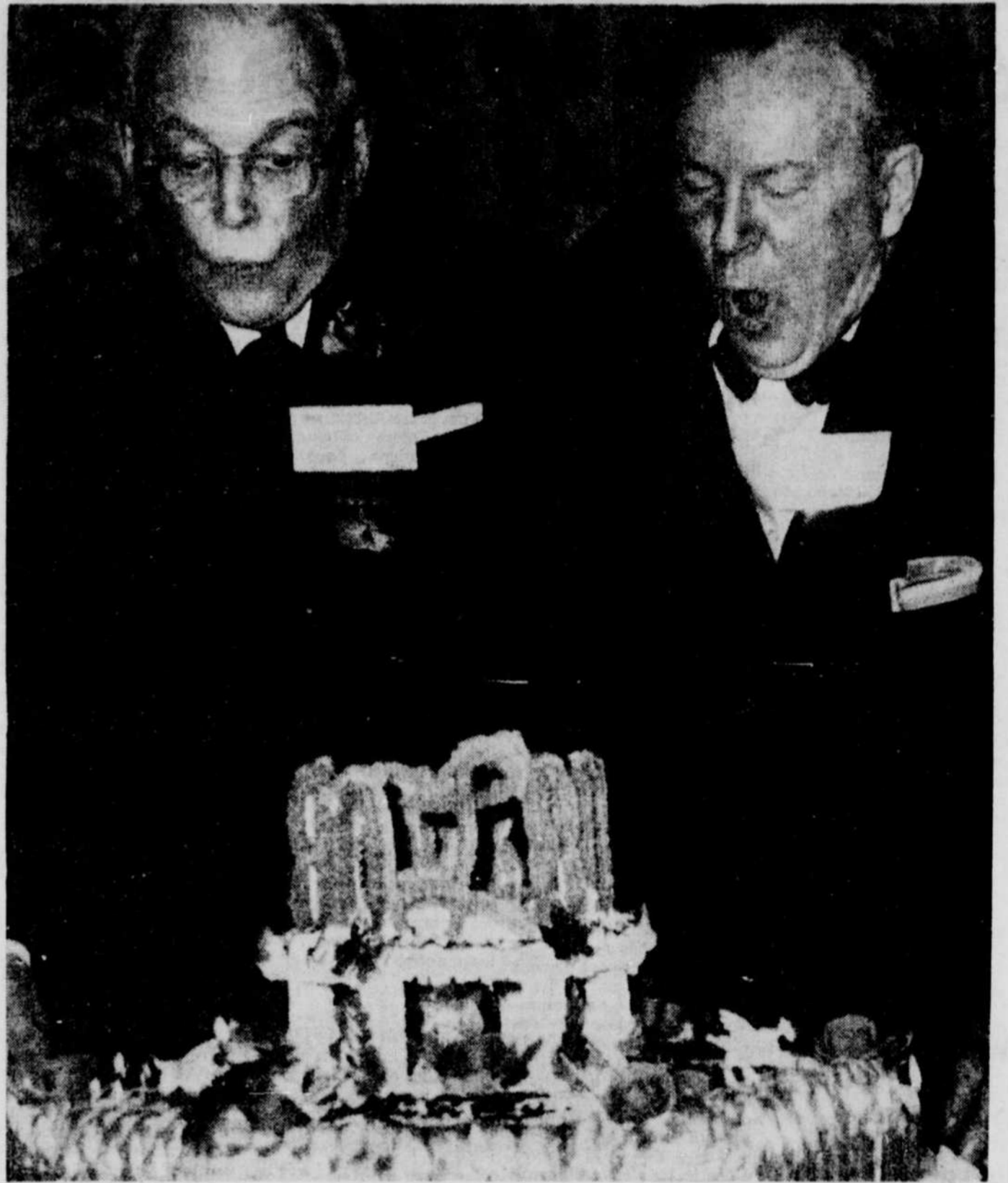
M. Lester B. Pearson aide M. St-Laurent à éteindre les bougies de son gâteau d'anniversaire au banquet du Parti libéral, au Château Laurier.

Si un avocat manque d'éthique, il reviendrait au Barreau d'intervenir au moyen de son comité de discipline et non pas de se fier uniquement au juge pour qu'il tranche la question à la place du Barreau, selon le député de Saint-Hyacinthe.