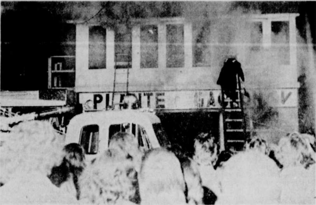
Plusieurs personnes sont sans abri depuis la nuit dernière. Un incendie a presque complètement détruit un immeuble de la rue Saint-Vallier. Les dommages s'élèvent à $75,000.

spectacles le midi au Parc des Gouverneurs et le soir à l'Institut Canadien. Le Circuit Temporaire est une troupe fondée il y a quatre ans qui joue des pièces susceptibles d'intéresser un public des plus variés.