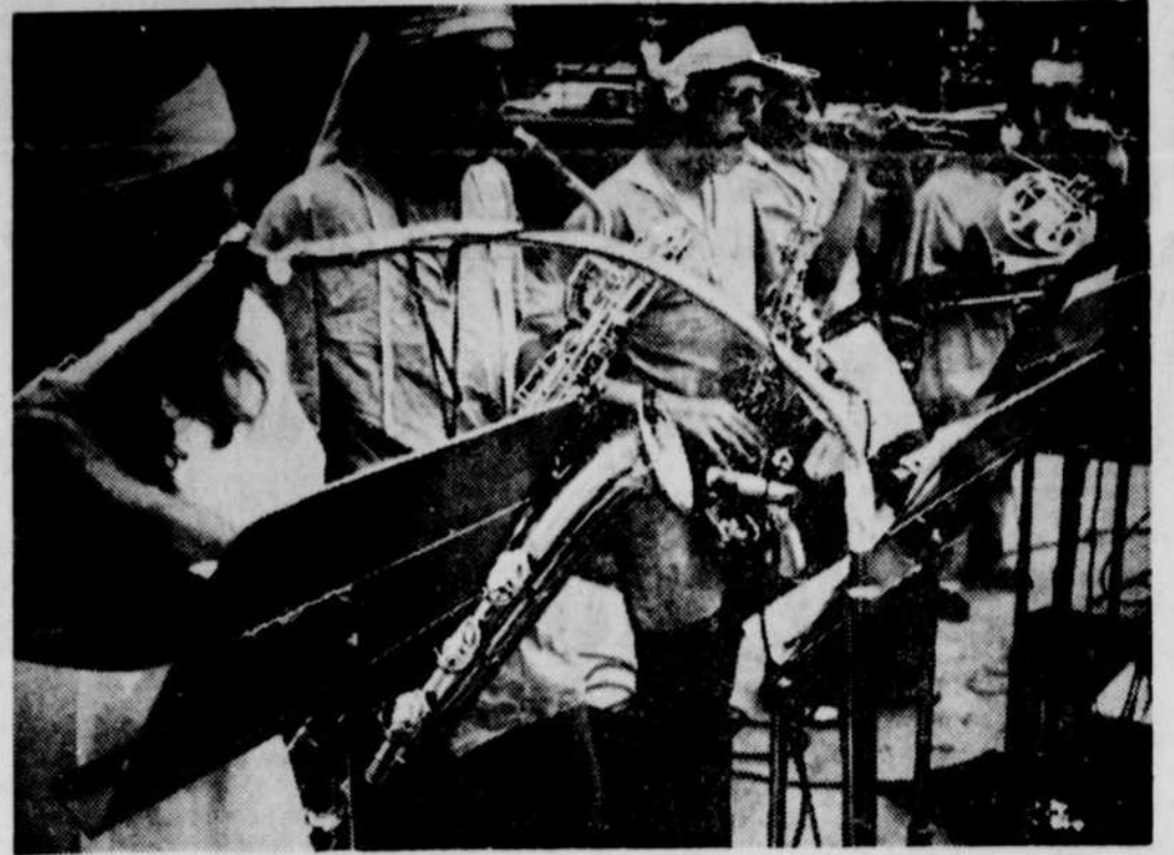
Le Festival d'été continue à se dérouler dans le Vieux-Québec, favorisé par une température on ne peut plus clémente. Hier soir, au Parc des Gouverneurs, c'était au tour de la troupe "Badou-Badour" de se produire sous le ciel étoilé.

1) la qualité du travail accompli sur la chaîne de montage laissait à désirer; 2) les réglages et réparations effectuées par certains concessionnaires n'ont pas toujours été de qualité; 3) certains propriétaires n'ont pas entretenu leur véhicule comme il le fallait et se sont peu conformés aux instructions du constructeur, provoquant une usure prématurée des pièces et autres pannes; 4) la dépréciation considérable de la Firenza est l'un des sujets de plainte qui revient le plus souvent.