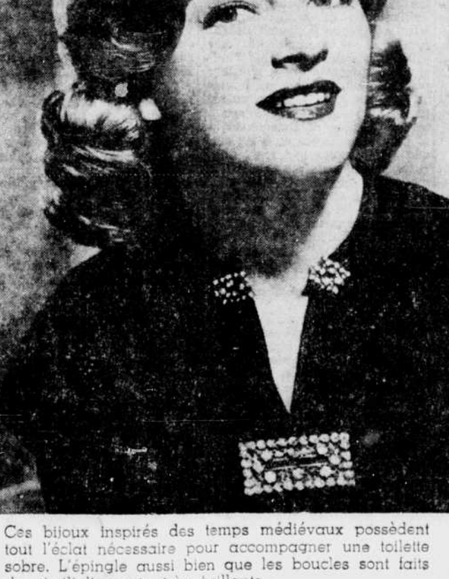
Ces bijoux inspirés des temps médiévaux possèdent tout l'éclat nécessaire pour accompagner une toilette sobre. L'épingle aussi bien que les boucles sont faits de simili-diamants très brillants.

Communauté anglicane. (PC) — Au coeur de Montréal, dans le quartier des taudis, se trouve un couvent où quatre religieuses anglicanes font un travail de bienfaisance chez les pauvres, et c'est là l'oeuvre connue seulement de quelques fidèles dans les cadres de l'Église anglicane.